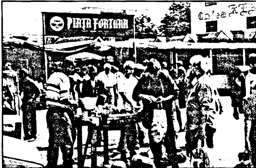
Prea mică pentru nevoile a circa 100.000 de locuitori, piața „Fortuna” din cartierul Aurel Vlaicu trebuie reamenajată și extinsă. T.O.P. S.A. este prima chemată să se ocupe de acest lucru