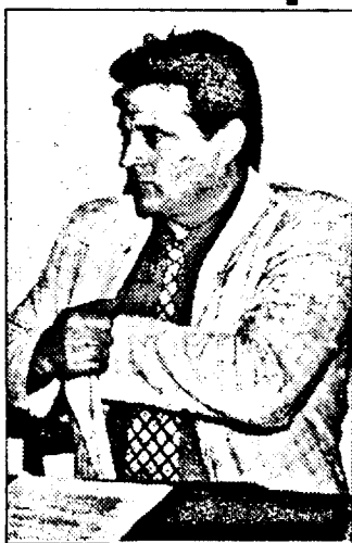
picioar în Prefectură și cu unul afară și nu va lua decizia de a-și cere demisia.

În data de 3 iulie a.c., Biroul Județean al PNȚCD Arad a hotărât retragerea sprijinului politic pentru prefectul Gheorghe Neamțiu. În acest sens, a făcut o cerere către BNC al PNȚCD, care a fost acceptată. Urmează ca ministrul Vlad Roșca să facă demersurile pentru ca în prima ședință de guvern să se producă revocarea prefectului și numirea noului prefect. PNȚCD Arad l-a propus pe dl. Ovidiu Nilă pentru această funcție. Până atunci însă, dl. Gh. Neamțiu rămâne prefect al Aradului, dacă nu s-o fi săturat să stea cu un