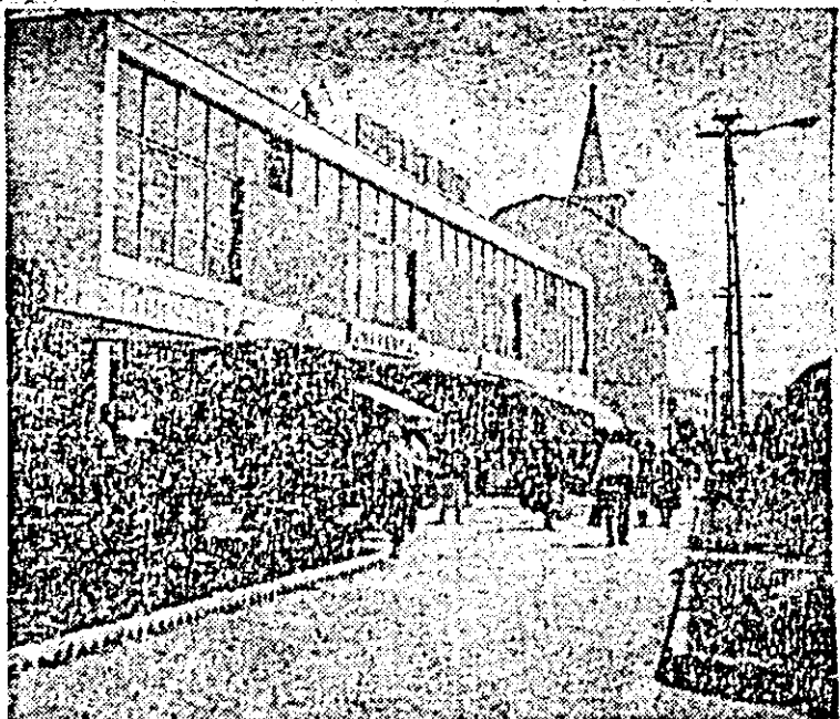
Ilustrată din Ineu.