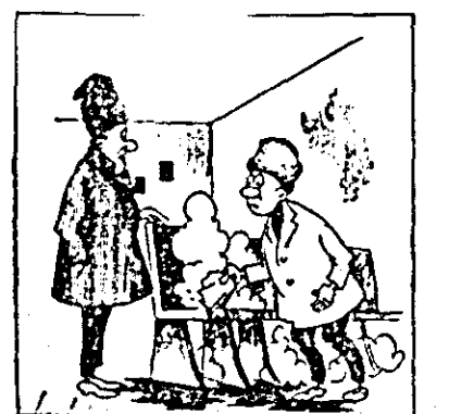
— Praful ridicîndu-se, seamănă a fum și poate așa avem senzație că e și cald.

Căminul cultural din Tisa Nouă este prost întreținut. Nu este încălzit iar praful stăruie din abundență peste tot