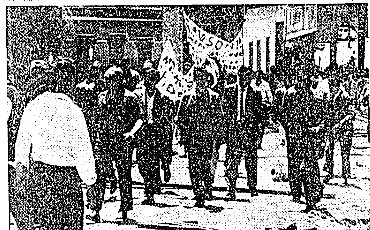
ARGENTINA. — Recent a avut loc la Buenos Aires o grevă a muncitorilor, organizată de Confederația Generală a Muncitorilor. ÎN FOTO: marșul muncitorilor spre piața Mayo.

Ministrul Informațiilor al Cambodgiei a făcut cunoscut miercuri într-o conferință de presă că Tailandă a violat din nou teritoriul cambodgian. O unitate a marinei thailandeze a trecut vineri frontiera dintre cele două țări în apropierea Golfului Siam și a deschis un puternic foc de armă sprijinit de tirul artileriei navale. Atacatorii au fost însă respinși de grănicerii cambodgieni. Ministrul a menționat că în apropiere de locul atacului, în dreptul Insulei Kong, patru vase militare thailandeze au atacat un distrugător aparținînd armatei cambodgiene. După cum se știe, guvernul cambodgian a dezbătut în repetate rînduri acțiunile agresive ale trupelor thailandeze asupra teritoriului cambodgien și a avertizat asupra răspunderii ce revine guvernului Tailandei pentru asemenea acte și a cerut ca ele să nu se mai repete.