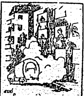
Total este să ne păstrăm calmul și... să ne înfundăm urechile.

Mulți locuitori ai Aradului sînt nemulțumiți de faptul că transportul gunoului menajer de pe străzile centrale ale orașului se face cu un autovehicul care — tirziu în noaptea — provoacă un zgomot infernal, îndeosebi pe străzile înguste, cu clădiri înalte, conturbînd liniștea reședințelor.