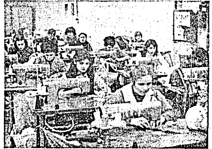
Aspect de muncă de la întreprinderea „Arădeanca”.