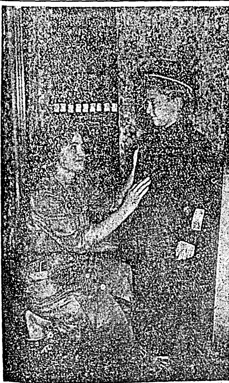
Prima uniformă școlară