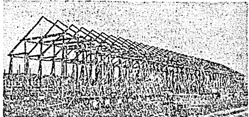
Colectivitățile din cartierul Micalaca pregătesc spațiul de depozitare a noii recolte de porumb. După cum se vede și din clișeu, peste cîteva zile în cîmp va fi gata.

Gospodăria agricolă colectivă „Donca Simo” din comuna Orășoara, sub îndrumarea organizației de partid și a consiliului de conducere, înregistrează succese tot mai importante în dezvoltarea sectorului zootehnic. În etapa actuală se pune un accent deosebit pe sporirea numărului de animale și ridicarea producției acestora. Astfel, pînă la sfîrșitul acestui an numărul bovinelor trebuie să ajungă în gospodăria noastră la 640 capete.