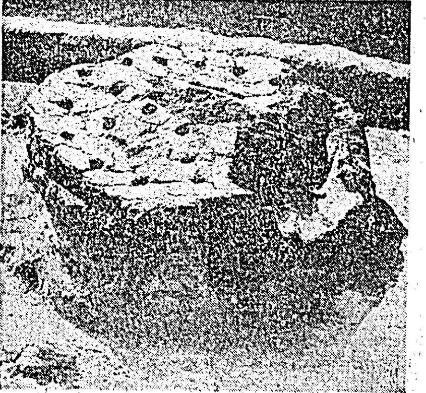
Gropi ale unor morminte de incinerare descoperite pe șantierul arheologic de la Ceala.

Pe lângă mormintele de care am vorbit, în săpăturile de la