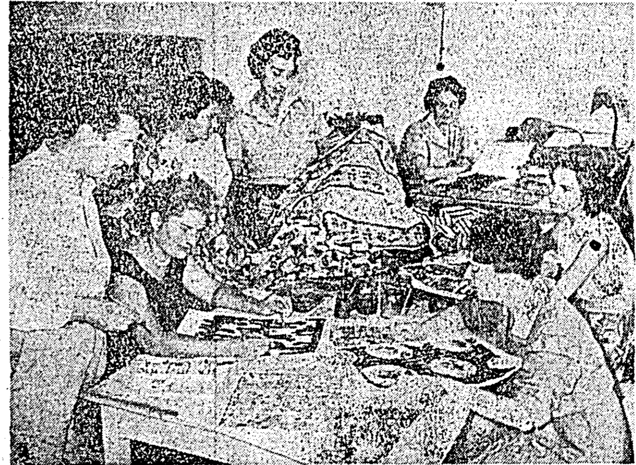
ÎN CLISEU: un aspect din secția de creație a Uzinelor „30 Decembrie”.

fol. 13 septembrie a. c. Teatrul de stat din Arad va mai prezenta în Capitală cîteva spectacole cu piesele „A treia, patetică” și „Răzvan și Vidra”, după care vor face un scurt turneu prin cîteva orașe din țară.