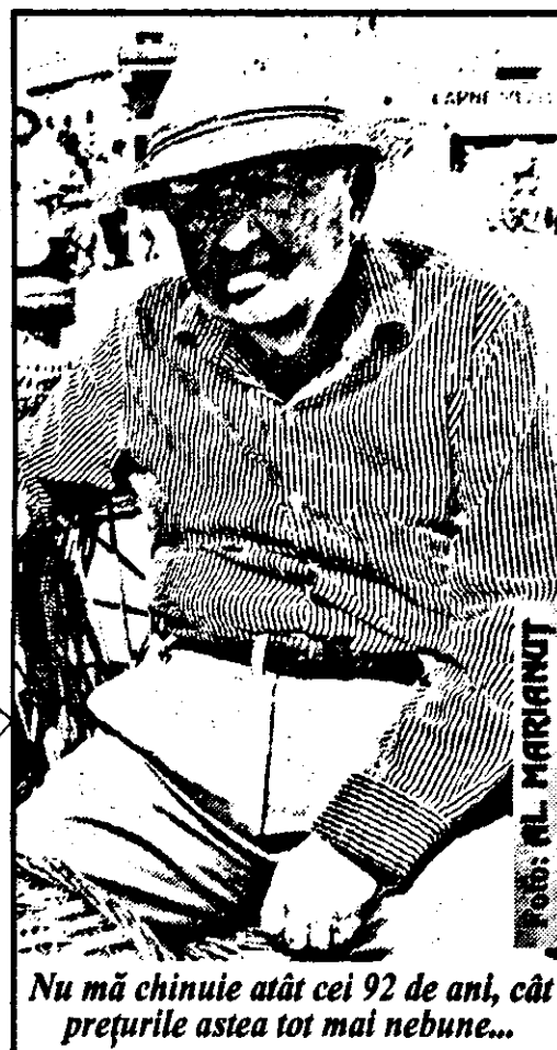
Nu mă chinuie atât cei 92 de ani, cât prețurile astea tot mai nebune...