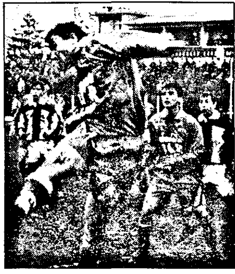
Campionatul trecut, cu Vargu în formație, UTA învingea la limită (1-0), în disputa cu Gaz Metan. Am fi mulțumiți dacă istoria s-ar repeta...