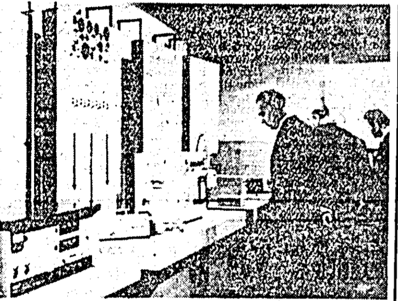
La Bratislava s-a deschis recent o expoziție de instrumente ale tehnicii nucleare, la care au fost prezentate produsele Institutului de cercetări în domeniul instrumentelor tehnicii nucleare din Premyslenski, în apropiere de Praga și ale Uzinei Tesla. Expoziția ilustrează situația actuală și posibilitățile existente pentru dezvoltarea în scopuri pașnice a energiei nucleare. IN CLISEU: Aspect de la expoziție.

ANTON ILICA — Arad. Vă invităm să treceți pe la redacție pentru a discuta în legătură cu materialul trimis.