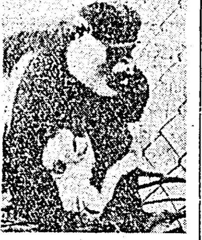
Grădina zoologică din Drezda este a patra grădina zoologică din Europa în care mama Guezeza: a adus pe lume un pui. Specia de maimuțe Guezeza este originară din Kenia și Tanzania.

SAIGON 20 (Agerpres). — Miercuri dimineața, la 67 kilometri nord-est de Saigon, patrioții sud-vietnamezi au atacat cu mortiere, rachete, și arme automate baza unei divizii de infanterie americane. În cursul după-amiezii de marți un convoi al pușcaciilor marini americani, format din 30 de vehicule, a căzut într-o ambuscadă a patrioților între Dong Ha și Que Son, la sud de zona demilitarizată. O violentă bătălie, care a durat peste patru ore, a fost angajată între patrioții și trupele in-