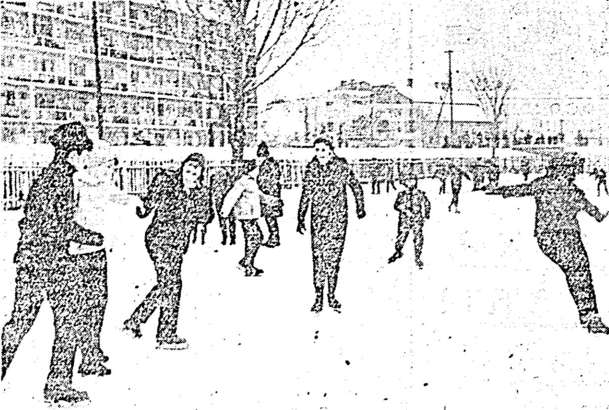
Patinajul rămîne, pentru cei mici, una din marile atracții ale iernii. La Arad, le stă la dispoziție în acest sens patinoarul Constructorul, de unde vă prezentăm imaginea de față.

Pe viitor, zețariile vor fi transformate cu ajutorul electronicii în birouri moderne. Firma „IBM” a prezentat pentru prima oară la Frankfurt (R.F.G.) mașina electronică „Magnet-band-composer”, care permite o economie de cheltuieli de până la 40 la sută și un randament de 4-5 ori mai mare în comparație cu zețariile de plumb obișnuite. Sistemul constă din două dispozitive de alimentare, pe care textele sînt scrise în același timp pe o bandă magnetică, precum și un dispozitiv de leșire cu agregate de comandă. Întregul sistem va costa 100.000 mărci. Noul sistem de culere tipografică va putea fi folosit cu succes și pentru tiparul offset la ziare. Cu acest sistem este posibilă înregistrarea a 14 semne pe secundă sau 50.000 semne pe oră, cu o calitate egală cu cea a zețului de plumb. Mașina rezolvă și corecturile și stersăturile ulterioare în text.