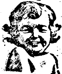
JELKEPE A TISZTASÁGON