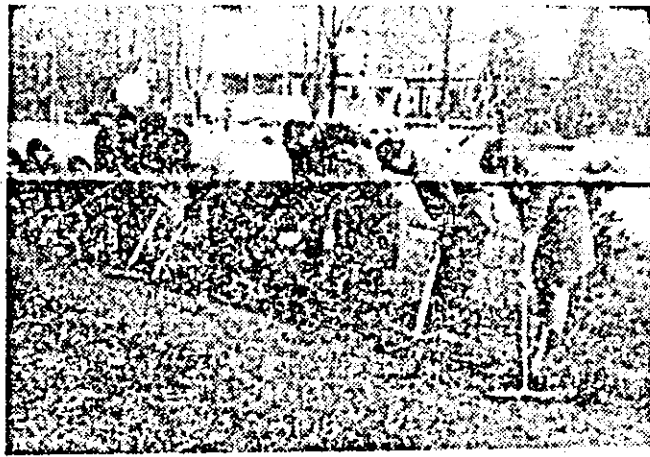
Oamenii muncii de la cooperativa de consum Chișneu Criș iau parte la acțiunea de înfrumusețare a orașului.