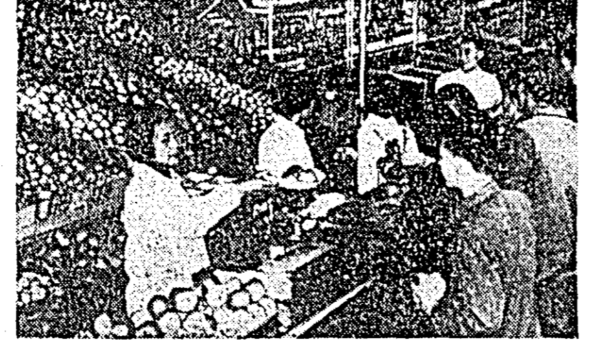
R. P. CHINEZA. Aspect dintr-o piață din Pekin: fructele neobținute de frumoase și proaspete atrag mulți cumpărători.

mai mult preț aurului dacă cele șapte țări membre ale Pool-ului n-ar fi pus la dispoziția acestui organism internațional o parte din rezervele lor de aur, pentru a alimenta piața și pentru a menține cursul aurului la suma fixată în urmă cu 30 de ani: 35 de dolari unca. În plus, țările americane au lansat pe piața vest-europeană 450 de milioane dolari pentru a putea face față eventualelor cereri de convertire a dolarului în aur. Cumpărătorii sînt, pe de o parte, particularii care și-au pierdut încrederea în marile monede de rezervă (dolarul și lira sterlină), iar pe de altă parte băncile și