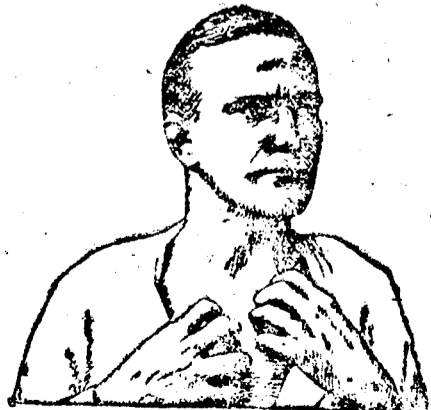
Ha bőrbetegségekben szenved, használja a CADU-M-KENŐCŐT

'Az új városi tanács ez esztendőben csak pontosan meghatározott keretek között működhet, amennyiben az 1926. évi költségvetés már miniszteri jóváhagyás után van és nekünk természetesen alkalmazkodnunk kell a budget előírásávalhoz. Nekem még nem volt alkalmam a költségvetést tüzetesen áttanulmányozni és így most még nem nyilatkozhatom arról, hogy a költségvetés egyes pontjai hol szorulnak a törvény keretei között mozgó módosításra. A magam részéről is legelső teendőnek tartom kiírtani a városházáról a korrupciót és megszüntetni a szegyenletes baksis-rendszernek még a látszatát is, azáltal, hogy a tisztviselőknek megfelelő megélhetését biztosítjuk. Nem beszélék most itt azokról a köztudomású hiányokról és szükségletekről, a melyeket az új tanács feladata lesz pótolni, hiszen az unalomig ismételt állandó programponatok ezek: vízvezeték, villamosvasut, városszépészet s fejlesztés. A képviselőtestület — meggyőződésem szerint — minden lehető el fog követni, hogy e valóban közszükségletet képező programponatok minél előbb megvalósuljanak.