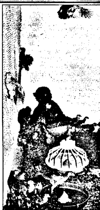
După 120 de zile, fazanii vor părăsi fazaneria luându-și zborul spre fondurile de vânătoare.

doi soți și-au stabilit reședința în fazanerie, iar din 1987 nu au mai fost în concediu de odihnă. Dovadă că la Adea, la fazanerie, este de lucru. Mai ales că creșterea fazanilor în captivitate nu este chiar atât de ușoară,