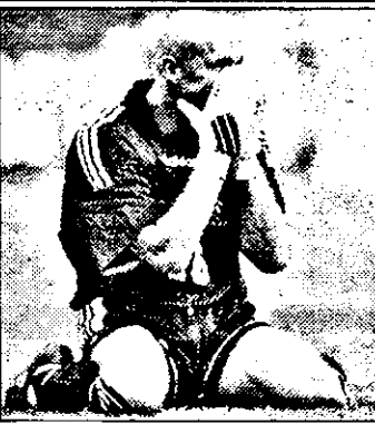
Portarul Barthez a fost unul din principalii artizani ai calificării Franței în semifinale la C. M. '98

dreptate, deoarece francezii au controlat autoritar partida și-au creat multe ocazii de gol și au jucat cu o ambiție ieșită din comun. De partea cealaltă, italienii s-au închis bine în defensivă și au încercat să-și surprindă adversarii prin contraatacurile lui Vieri și R. Baggio, dar Thuram și Desailly s-au dovedit a fi de netrecut.