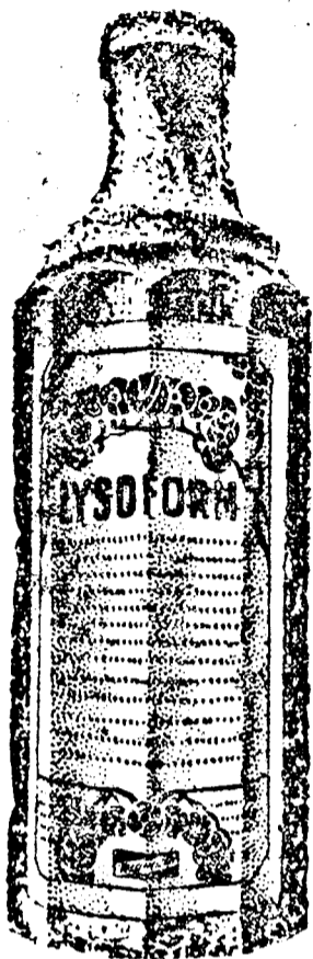
Megfelelő nagyszámban a Lysoform megöli a tudomány ismerte legellenállóbb bacillusokat.

ERŐTELJES antiszeptikum, elég hatékony, hogy a tudomány által ismert legellenállóbb bacillusokat megölje, a Lysoform, megfelelő oldatban az ideális antiszeptikum a nő „intim toalett”-je számára.