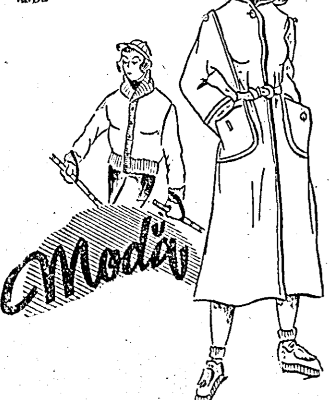
Doză modele sport pentru sezonul de iarnă