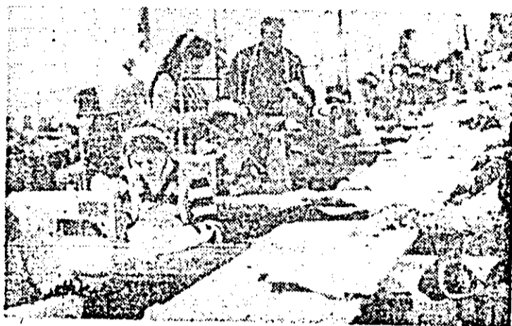
Aspect din secția confecții-serie a cooperativei meșteșugărești „Artex” Arad.