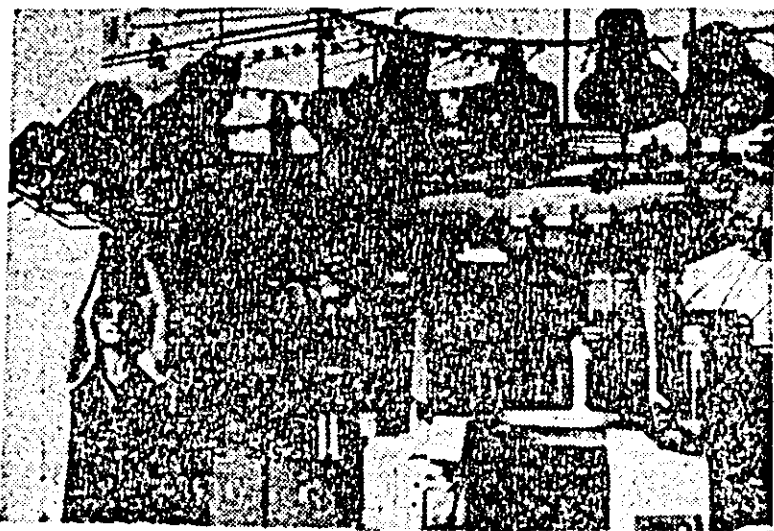
Preocupat permanent de gospodărirea judicioasă a materialelor prime, de reducerea consumurilor specifice pe toate etapele procesului de producție, colectivul de muncă al întreprinderii „Tricolor roșu” însere la stîrșitul celor opt luni la capitolul economiei peste 8 tone fire de bumbac și amestec de bumbac cu alte fire sintetice. De asemenea, prin utilizarea rațională a mașinilor și utilajelor în această perioadă s-a redus consumul de ace de tricotal cu peste 100 000 bucăți.

(Din Decretul Consiliului de stat nr. 231/1974)