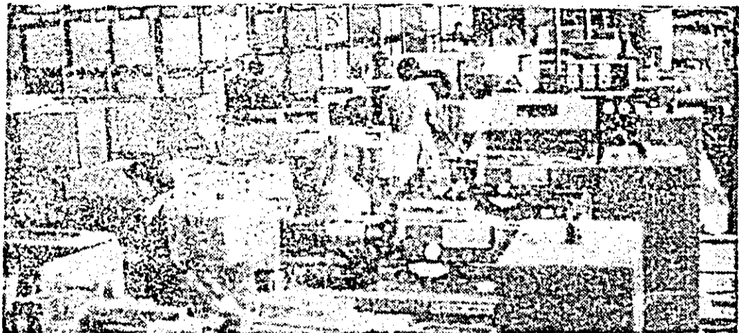
Dotat cu utilaje moderne, de mare productivitate, atelierul de injectat mase plastice al întreprinderii „Arădeanca” aduce o contribuție majoră la îndeplinirea sarcinilor ce revin întreprinderii.