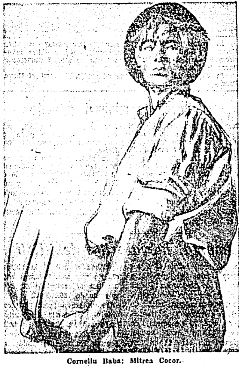
Corneliu Baba: Mîntrea Cocor.