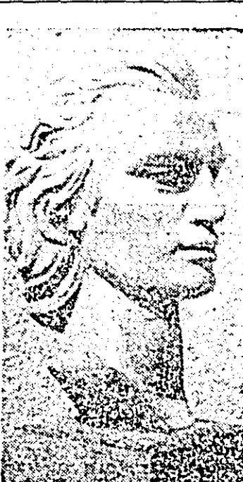
„MIHAI EMINESCU” — bust realizat de sculptorul arădean Grigore Pop. Iau-reat al festivalului muncii și creației libere.