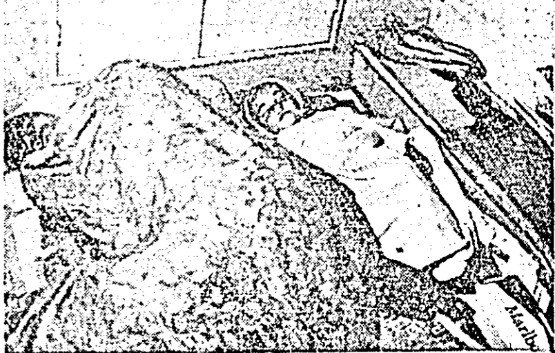
„Ocotirea mamei și a copilului” înseamnă la Rio de Janeiro (Brazilia) un culcuș de platră la intrarea unui clădirii.