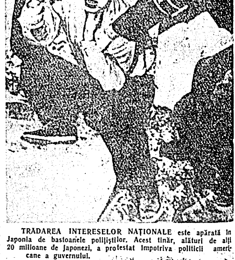
TRADAREA INTERESELOR NAȚIONALE este apărută în Japonia de bastoanele poliștilor. Acest tânăr, alături de alți 20 milioane de japoanezi, a protestat împotriva politicii americane a guvernului.

puterintel — presa burgheză care le face reclamă, autoritățile care li ocrotesc, capitalismul care li generează. Dar cei mai feroc veniți susținători ai acestui sort de paraziți sînt tot niște paraziți, cei mai paraziți din paraziții societății capitaliste. Clienții lui Irving Stone fac parte din „marea societate” și aceștia nu se uită la bani cînd este vorba de alungarea plictisului, de asigurarea „succesului în dragoste”. „La New York sînt mai mulți superștiștoși decît ai crede”, spune Stone. Mulți doctori se scurg în teșcheana șarlatanului din Manhattan din