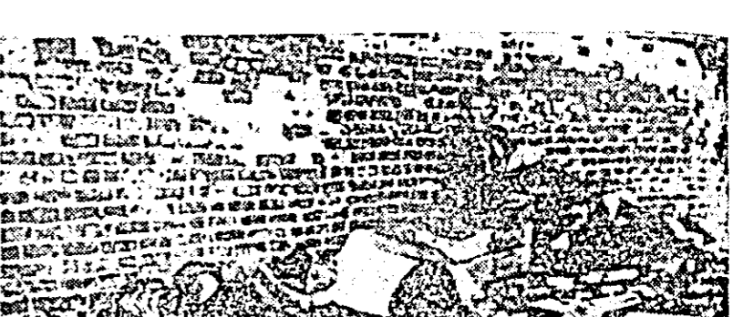
MIZERIA crescîndă a populației este oglinda vie a modului de viață capitalist. Iată „locuința” rezervată unor cetățeni din Chicago, S.U.A. — cea mai bogată țară capitalistă.