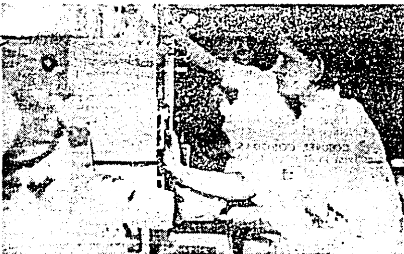
In laboratoarele Combinatului chimic se desfășoară în aceste zile o activitate intensă.