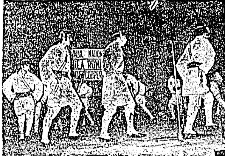
Recent, în cadrul fazei Intercooperatiste a Festivalului național „Cîntarea României”, pe scena casei orășenești de cultură din Nădlac, formația de dansuri populare a căminului cultural din Șeitin, a prezentat o interesantă versiune locală a călușarilor ce s-a bucurat de frumoase aprecieri din partea publicului.