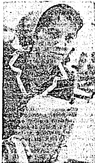
Florica Drig, una dintre fruntașele în producție de la întreprinderea „Tricolor roșu”, își realizează permanent sarcinile de plan în proporție de 118—120 la sută.