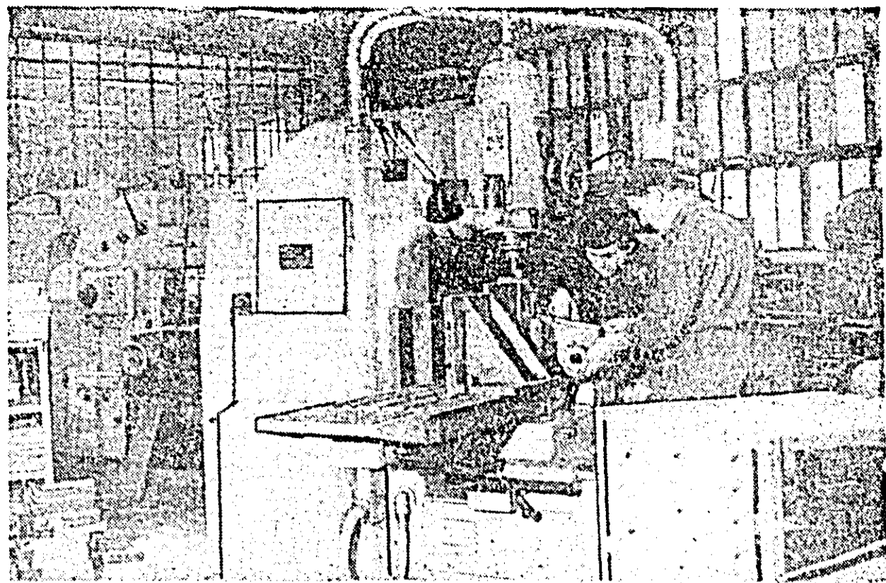
Secvență de muncă din secția scularie a Uzinei de strunguri din Arad