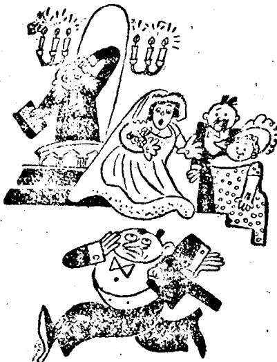
A VÖLEGÉNY: Te jó Isten, ugylátszik, eltévesztettem a templomot...!

— A hadviselték nemzetközi kongresszusa Rómában, Rómából jelentik: Ma nyílt meg a hadviselték nemzetközi kongresszusa, amelyen 14 nemzet képviselőiben 25.000 ember vett részt. Elküldték megbízottjaikat a háboruban szerepelt összes nemzetek, kivéve Angliát. Az angol kormány ugyanis nem engedte meg az utazást az angol küldöttség tagjainak.