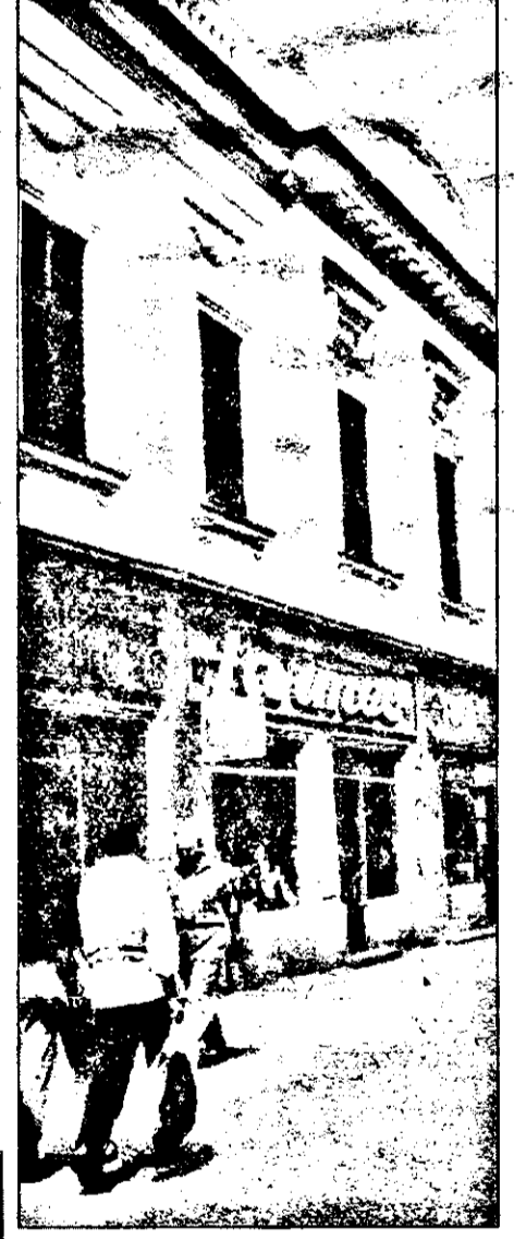
O clădire care nu mai are nici un... farmec!