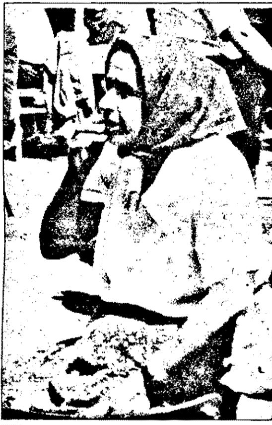
„Doamne, dar mai ține mult tranziția asta?”