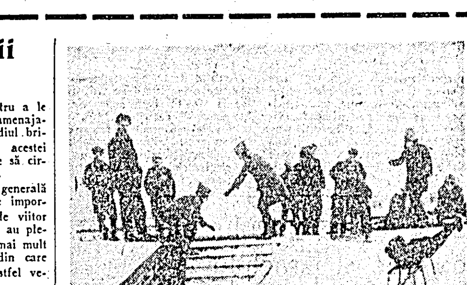
LA DERDELUȘ