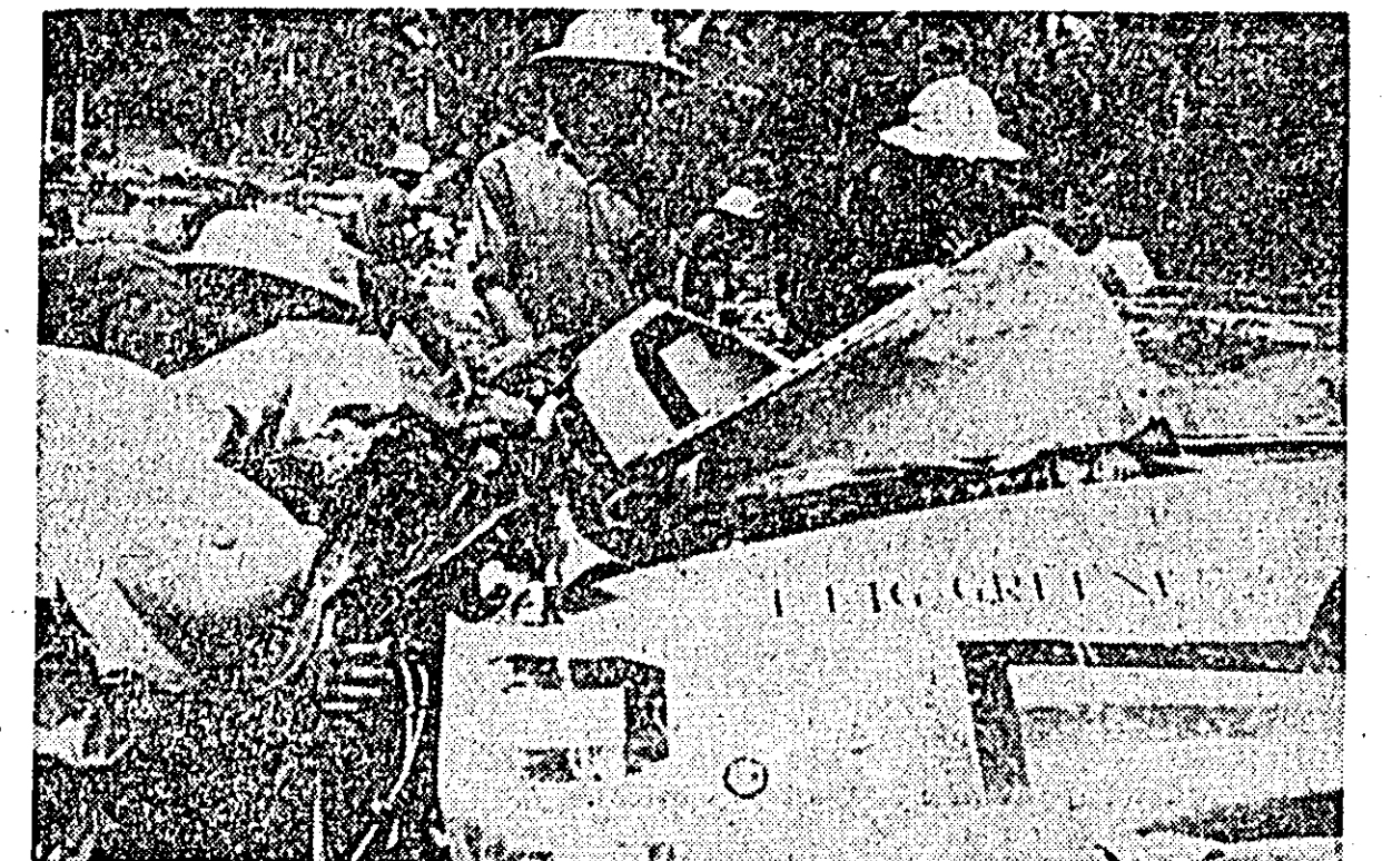
R. D. VIETNAM. — Armata și poporul nord-vietnamez obțin victorii strălucite în lupta de rezistență împotriva agresiunii americane. IN FOTO: Rămășițele unui avion american doborât de forțele vietnameze.