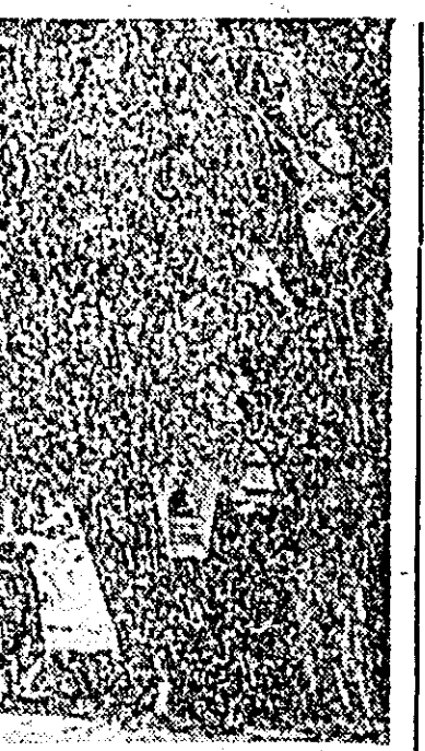
R. P. BULGARIA: Una din cele mai interesante curiozități ale Bulgariei — bătrînul ploș din orașul Pesteria, care, conform aprecierii specialiștilor are 830-900 de ani. Diametrul coarnei lui este de 10 metri și 20 cm.

de compasiune față de familia fostului președinte al SUA, și că, după părerea sa, nu există motive care să determine modificarea textului original.