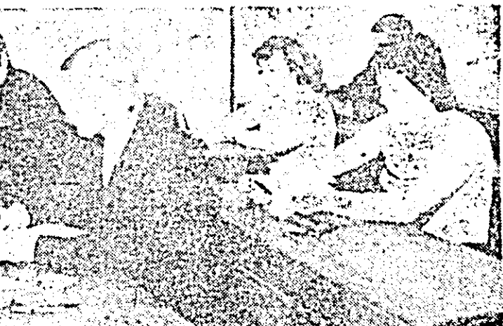
Bacalaureatul! De cîteva zile, noi promoții de tineri trec prin aba de foc a examenelor ce le atestă temeinicia cunoștințelor a maturității, ca acești absolvenți ai Liceului de mecanică nicolă din Sîntana.