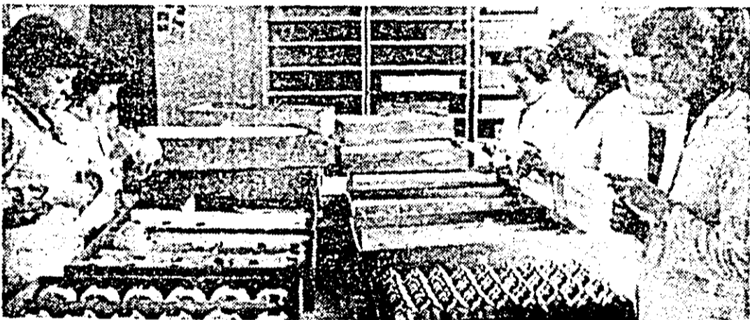
Secvență de muncă din atelierul control final al întreprinderii „Victoria”.

300 tone, valorînd 2,5 milioane lei. Totodată s-au cules peste 700.000 flori, depășindu-se producția globală planificată cu peste un milion lei. În cursul acestor luni fiind desfășurate cu amănuntul, cu 5,5 milioane mai multe flori față de cum s-a propus.