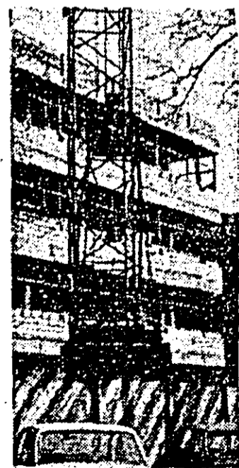
Aspect de pe șantierul noului sediu al Centrului județean de protecții.