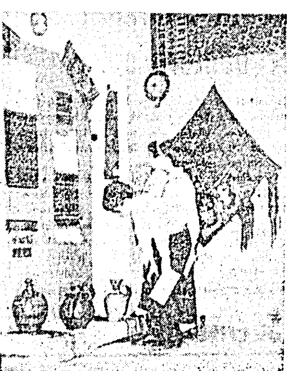
Aspect de la expoziția „Căutătorii de comori” deschisă la Casa pionierilor.

Pot fi văzute în staturile frumoase amenajate obiecte care figurează și aparțin celor peste 100 de muzee și culturi muzeice școlare și care sînt rodul investigațiilor duse cu entuziasm și pasiune de purtătorii cravatei roșii dornici să descopere frumusețile și logățile ființului natal, ale culturii milenare a poporului nostru.