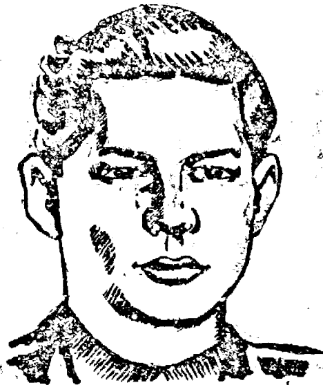
M. S. REGELE MIHAI I.

Poporul român va și vesnic recunoaște marilor aliați, în frunte cu Uniunea Sovietică.