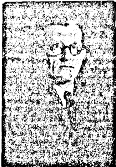
ANTON ALEXANDRESCU ministrul cooperăției

Am constatat că organizația național-țărăniștă din Arad neînțind seamă de dorința cadrelor a instaurat prin metode samavolnice la conducerea