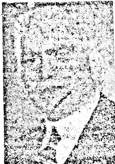
D. DR. PETRU GROZA

Comisia economică pentru Balcani și Finlanda a aprobat art. 24 din tratatul de pace cu România care prevede restabilirea proprietăților Națiunilor Unite aflate pe teritoriul României la 1 Septembrie 1939. S'a aprobat totodată și amendamentul prezentat din partea delegației poloneze conform căruia această dispoziție se referă și la bunurile care au fost aduse după 1 Septembrie 1939 de cetățenii polonezi în România și care ulterior au fost confiscate din partea Statului Român.