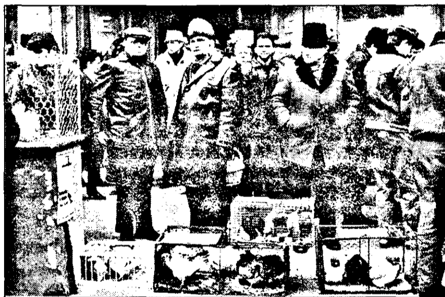
Profitând de ultima zi a Expoziției anuale de păsări și porumbei, vânzătorii din Piața exotică s-au mutat pentru câteva ore pe Bulevard. Evident, fără taxe... Dar după toate probabilitățile cu vânzări mai mari!