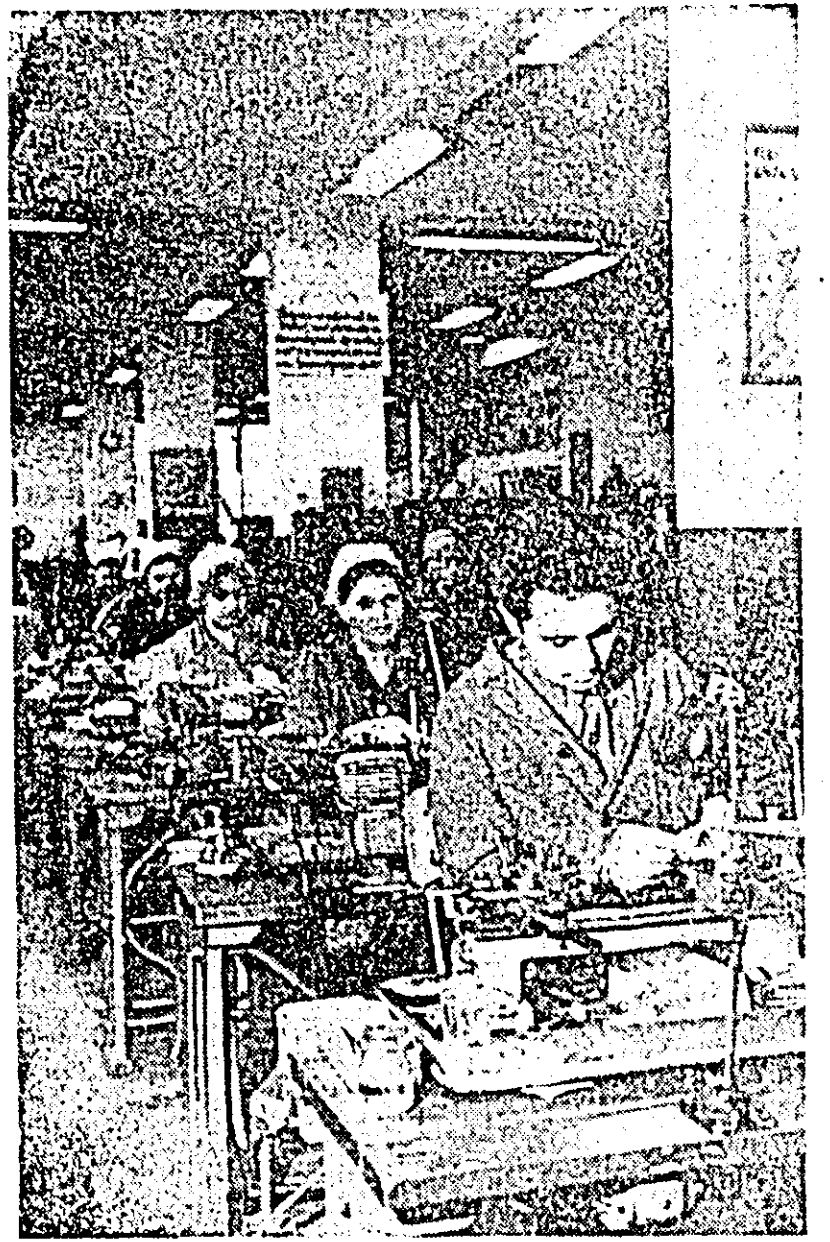
Aspect de muncă în secția uzină a fabricii de ceasuri „Victoria” Arad.