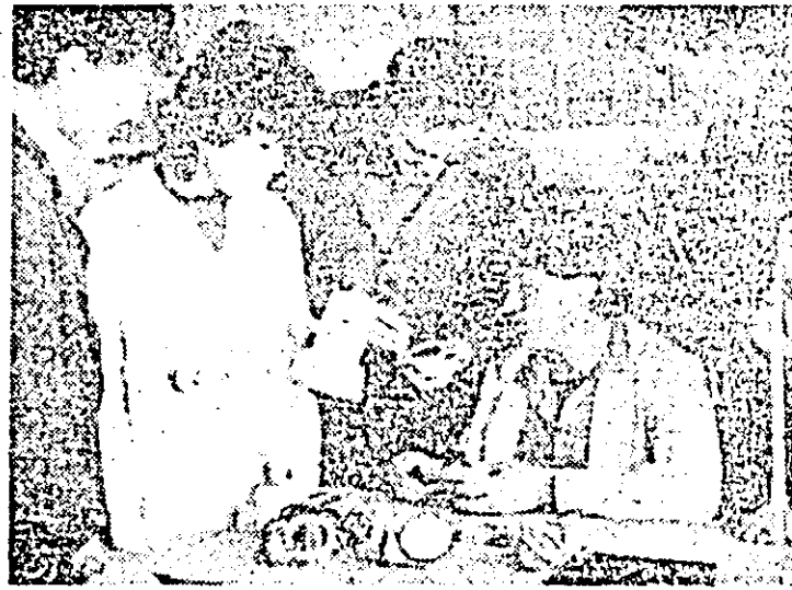
Întreprinderea de orologerie. În secția montaj, se urmărește cu atenție realizarea noului produs: tahometrul centrifugal portabil.