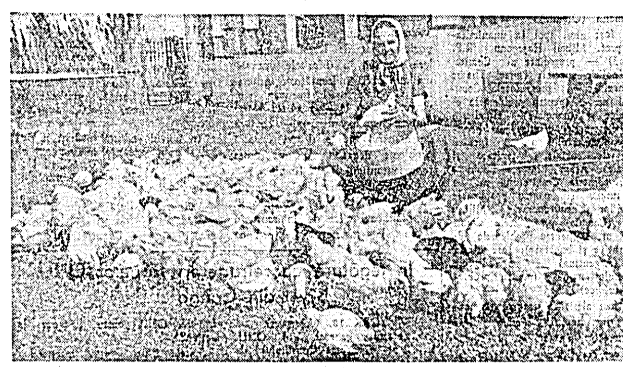
La gospodăria agricolă colectivă „30 Decembrie” din Vinga sectorul avicol este într-o continuă dezvoltare. Față de anul trecut în anul acesta numărul pulilor creșcuți în gospodărie s-a dublat, ajungînd astfel la 4.400.