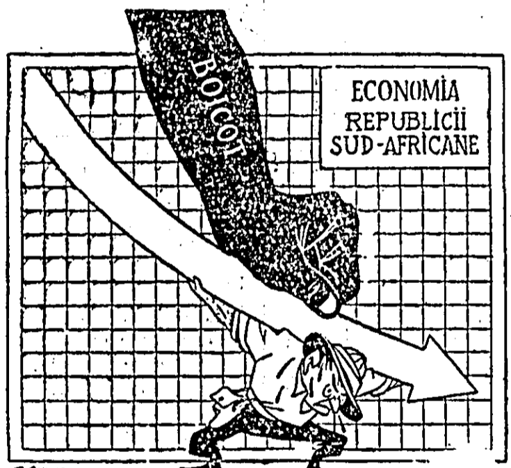
FARA CUVINTE (Desen de A. RIK)