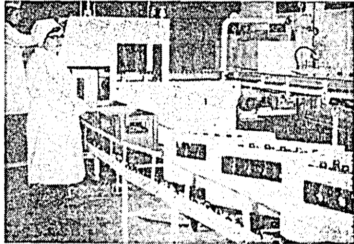
Aspect de muncă din noile unități de pe platforma industrială Nord-Vest a municipiului.

NICOLAE CEAUȘESCU Președintele Republicii Socialiste România