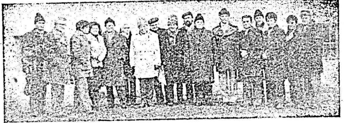
Participanți la cel de-al III-lea Simpozion național de tracologie, în fața muzeului orașenesc din Lipova.

(Din cuvântarea rostită la Marea adunare populară din municipiul Arad de la 28 martie 1979)