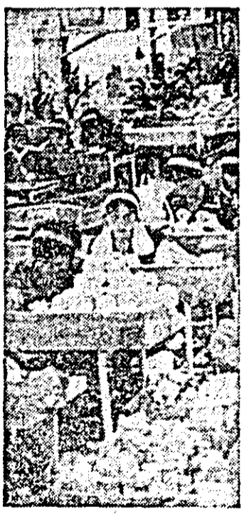
Aspect de muncă din secția pictat a întreprinderii „Arădeanca”.