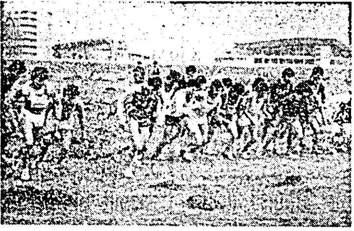
Start în una din probele etapei zonale de cros.

• Așadar, fură pe aici și otenii și jucară cum jucară, de parcă se temeau să nu piardă avionul de München. Fîndcă, deși se vede cît de coloză au o echipă bună, cea mai bună la noi în momentul de față, n-aș putea spune că studenții s-au ostenit prea mult atîcînd poarta lui Duckadam. Probabil că rezultatul partidului a fost cel dorit de el, deși n-a lipsit mult să ne lase orfan de ambele puncte. • Cit despre UTA, ce să zic? A jucat mai bine decît cu F.C. Olt, dar n-a avut nici o ocazie care să-l bașe pe studenții în sperieți. În consecință, textiliștii n-au marcat nici sîmbătă, cum n-au făcut-o nici în etapa anterioară, ceea ce spune ceva. Oare nu e bător la ochi că în două meciuri jucate acasă, consecutiv, plasa oaspeților a rămas nealinsă? • Ceva nu merge în jocul ofensiv al alb-roșilor, se joacă