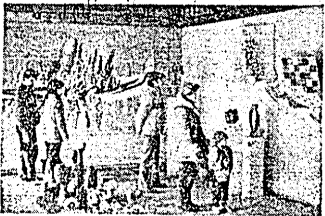
Aspect din expoziția de la sala „Alfa”.