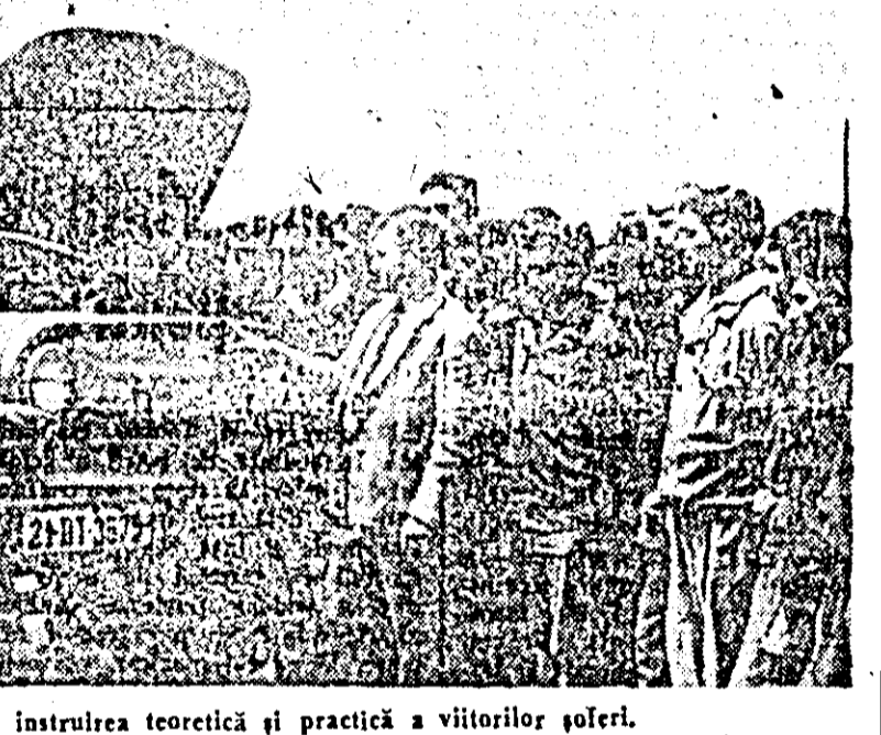
Aspecte de la instruirea teoretică şi practică a viitorilor şoferi.