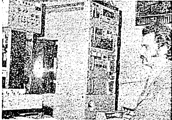
O „bijuterie” tehnologică — mașina de prelucrat prin electroeroziune, este unul dintre utilajele de mare precizie și randament aflate în dotarea întreprinderii „Victoria”.

Un important succes au înregistrat în activitatea lor și cooperatorii meșteșugari din județul nostru. Depășirile de plan din lunile anterioare le-au permis să raporteze, odată cu îndeplinirea înainte de termen a planului pe șapte luni la toți indicatorii, și importante sporuri. La producția marfă ei se cifrează la circa 25 milioane lei, livrările la fondul pieții fiind majorate, peste prevederi, cu circa 10 milioane lei. De asemenea, rezultate bune au fost obținute și în activitatea comercială, domeniu în care depășirea se ridică la peste un milion lei. Dar cel mai semnificativ succes este îndeplinirea, în proporție de 100,5 la sută, a planului de export. Cele mai bune rezultate au fost obținute de cooperatorii