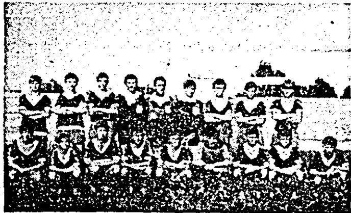
Iată-i pe tinerii fotbalisti de la Școala generală nr. 13 înainte de începerea unei noi partide.