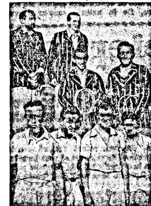
Cele două echipe, sus cea germană, iar jos cea jugoslavă.