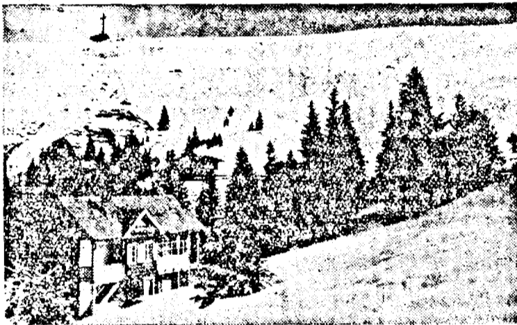
Un aspect dela Muntele Mic

Incheiem acum seria de reportaje, care cuprinde tot ce s'a făcut pentru o viață mai