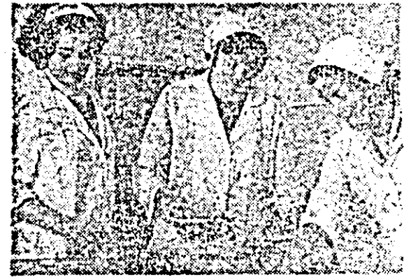
Elevii ale Liceului de alimentație publică Arad în practică la laboratorul școlii din cadrul Complexului școlar comercial „Tineretului” Arad.

face injecțiile prescrise. Cui trebuie să se adreseze în acest caz și cum se rezolvă această problemă? Răspunsul urmează să-l primim la redacție pînă marți, 29 martie a.c.