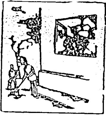
— Noi ce facem? — Așteptăm încă dol și facem un remy.

Zilele trecute, pe strada Ghîba Biria un mare număr de cetățeni au participat la lucrările de curățenie. Alții însă au preferat să privească de la geamul apartamentelor desfășurarea acțiunii.