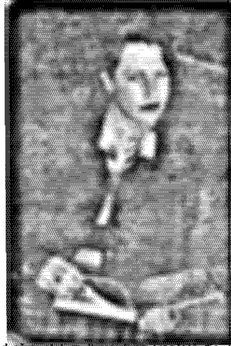
...tul că sunteți mult mai bine pregătită din punct de vedere profesional.

2. Nu fiți distanțat! Dacă v-ați hotărât să despărțiți problemele personale de cele de serviciu, acest lucru nu înseamnă că trebuie să fiți excesiv de distanțat în relațiile cu colegii dvs. Fiți întotdeauna amabil și răspundeți-le cu simpatie, ori de câte ori vi se cere părerea sau când trebuie să rezolvați împreună o problemă de serviciu. De asemenea, nu ezitați și cereți-le părerea atunci când este cazul. Nu încercați să păreți atotștiutoare și evitați să apălați la ironii, chiar dacă sunteți conștientă de faptul că sunteți mult mai bine pregătită din punct de vedere profesional.