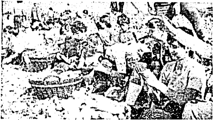
Elevii Școlii generale nr. 4 Arad lucrează la depănătură porumbului la I.A.S. Hîntinele.

— Care este stadiul recoltării porumbului? — Concomitent se acționează, în continuare, atât mecanic cât și manual, pentru strângerea cât mai grabnică a porumbului din câmp și predarea acestuia la baza de recepție. Sînt frumuse C.A.P. Birsa, cu peste 350 ha recoltate, Buteni 200 ha, Hodis 150 ha. Nu același lucru putem spune despre C.A.P. Culeș care a recoltat porumbul de pe o suprafață mică.