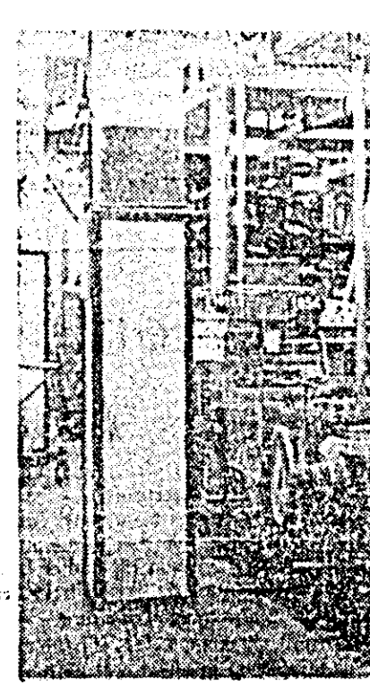
Aici, într-unul din compartimentele uzinelor „30 Decembrie” se țes vestitele prosoape florișoale, pentru calitățile lor în întreaga țară și peste hotare.

metodă folosită de acel muncitor calificat pe lângă care este repartizat. Intenționăm trecerea la instruirea muncitorilor pe bază de filme. În acest sens, la locurile de muncă cu pondere mare de muncitorii se determină metoda cea mai rațională de muncă (folosind metode de studiu muncii și sistemul M.T.M.) după care un muncitor calificat este instruit să lucreze conform acestei metode. Se trece apoi la filmarea diferitelor faze de lucru executate după metoda de muncă stabilită (filmarea făcându-se cu 64 secvențe). Aceste filme vor fi proiectate de mai multe ori în fata aceluiași muncitorii (proiectarea facin-