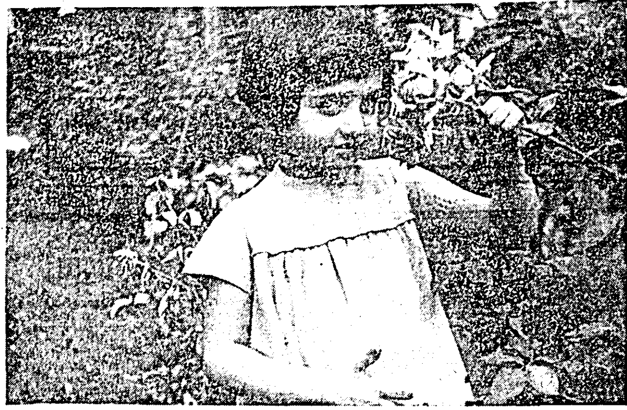
Floare între flori.