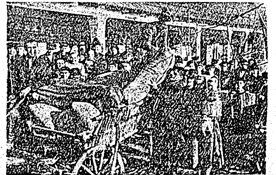
ÎN CLÎȘEU: În curtea frunțașului Ștefan Schönecker se descarcă sacii cu grîu, rodul muncii sale.

După adunare, un grup de colectivități, orchestra, l-au însoțit pe frunțași gospodăriei colective cu carele încercate de saci, pînă acasă.