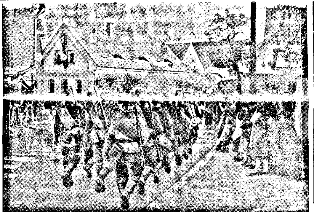
Einmarsch des subetendeutschen Freikorps in seine Heimat. Diese Aufnahme wurde in dem subetendeutschen Ort Saslau zwischen Wisch und Eger gemacht und zeigt subetendeutsche Freiwillige auf dem Marsch in ihre Heimat.

kunft mit Mussolini benutzen und zu dieser auch den französischen Ministerpräsidenten Daladier beiziehen.