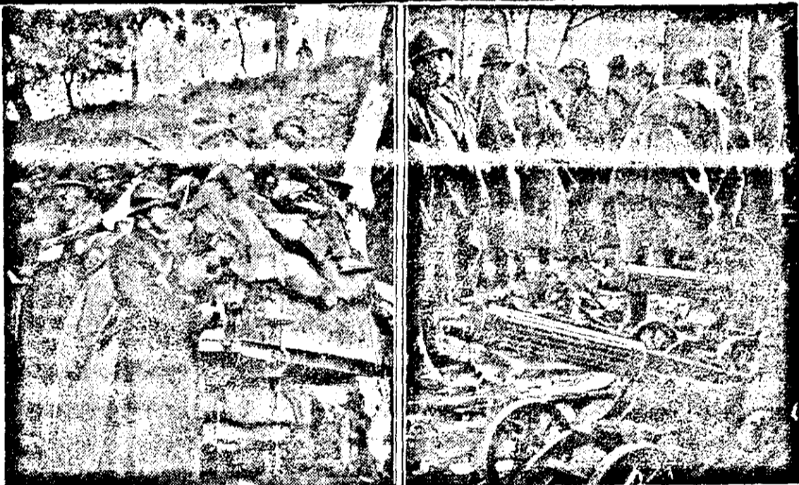
Die Waffen häufen sich an der französischen Grenze

In Bukarest selbst fand diese Feierlichkeit auf dem Höhepunkt und obwar die Betriebe arbeiteten und die Geschäfte offen waren, versammelten sich Zehntausende bei der Feier, die glanzvoll vor sich ging. Schon tags vorher sind aus allen Lei-