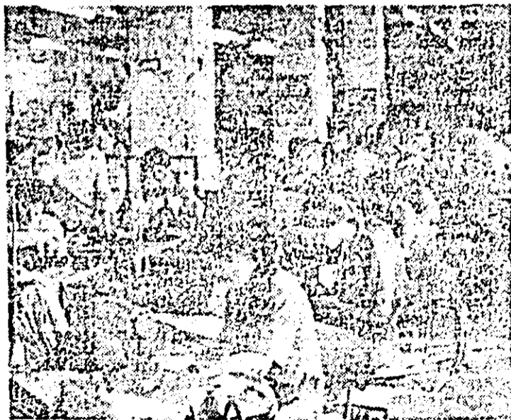
Aspect de muncă în secția I a întreprinderii de confecții.

• În comunicatul celei de-a treia runde a Comitetului ministerial de normalizare a relațiilor dintre Etiopia și Somalia, desfășurată la Addis Abeba, se relevă că cele două părți, pe baza dorinței reciproce de a continua dialogul, au convenit ca următoarea rundă de convorbiri să aibă loc la Mogadiscio.