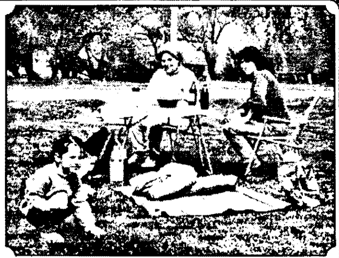
La Zori de zi, arădenii au ieșit timid la iarbă verde. Se vede că primăvara se lasă încă așteptată.