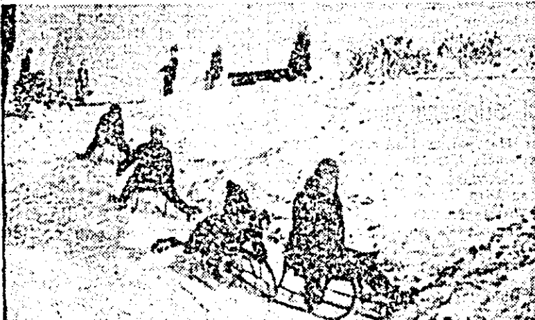
După mai multe zile ca de primăvară, pe meleagurile noastre s-a așternut din nou zapada. Copiii așteaptă să se joace în ea.